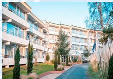
Weissenhäuser Strand Hotel

Grundpris Dobbeltværelse ved 2 personer. (Enkeltværelse kan fås mod tillæg).